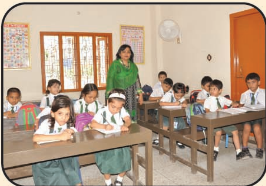
পাঠদানরত অবস্থায় শ্রেণি কক্ষের একটি দৃশ্য