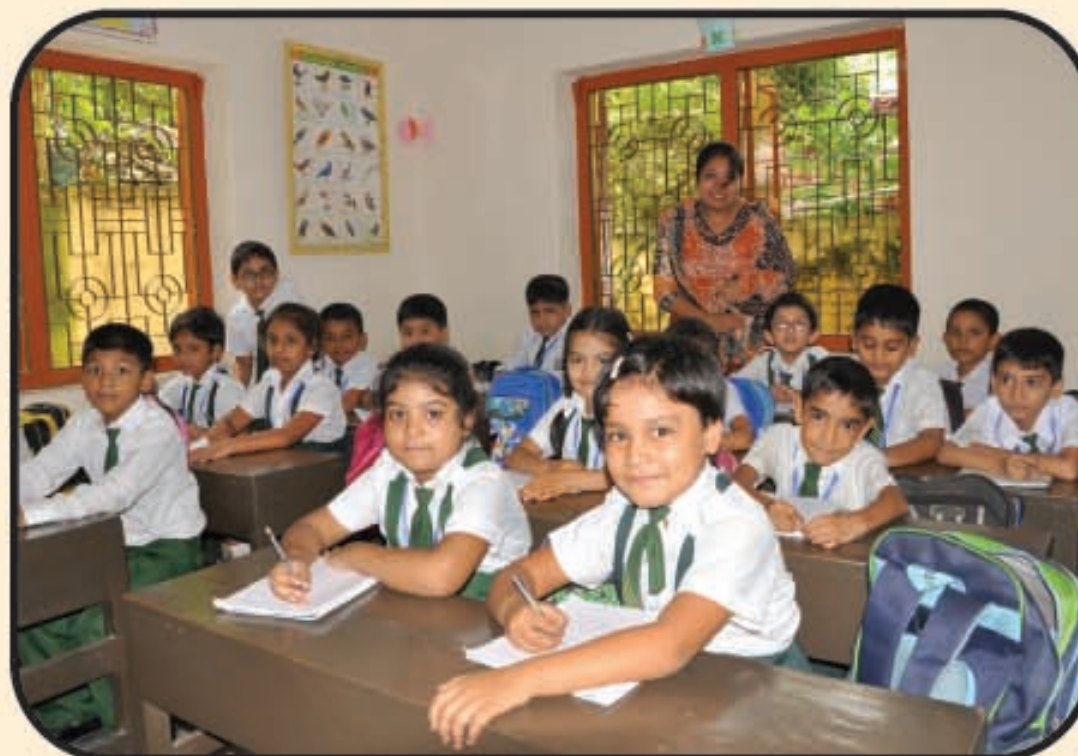
পাঠদানরত অবস্থায় শ্রেণি কক্ষের একটি দৃশ্য