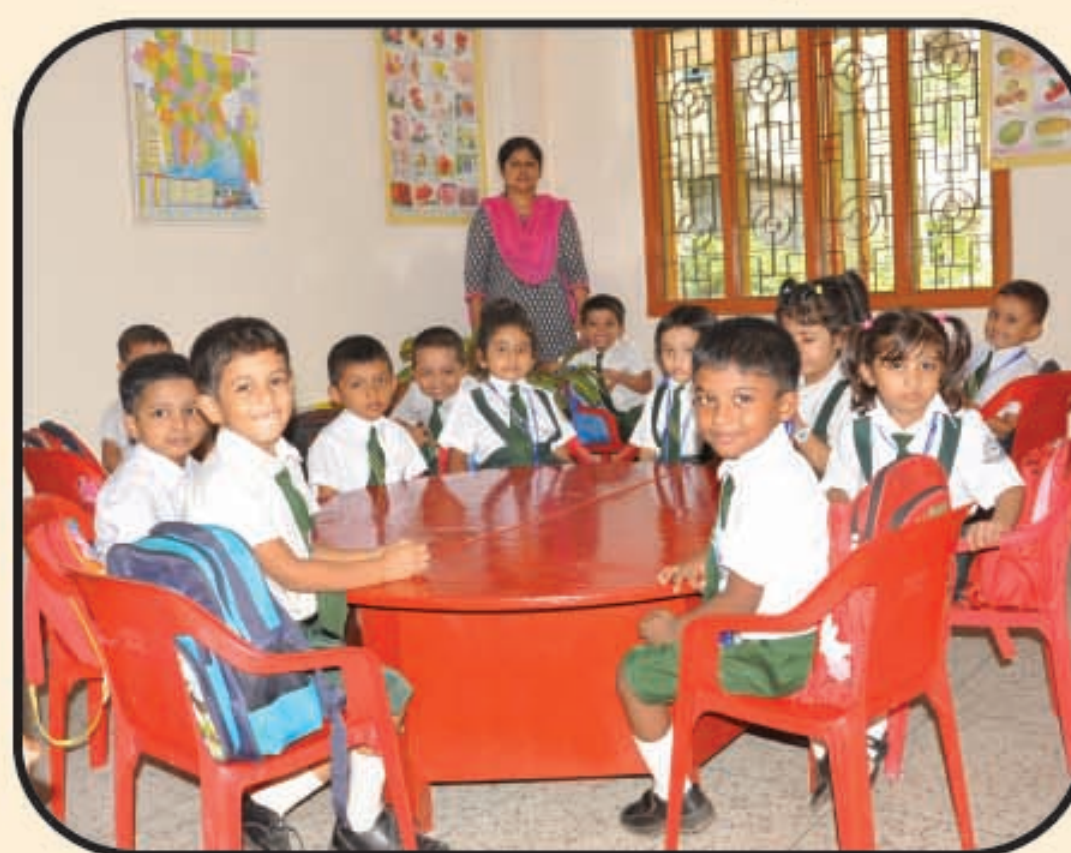
A View of Class Room