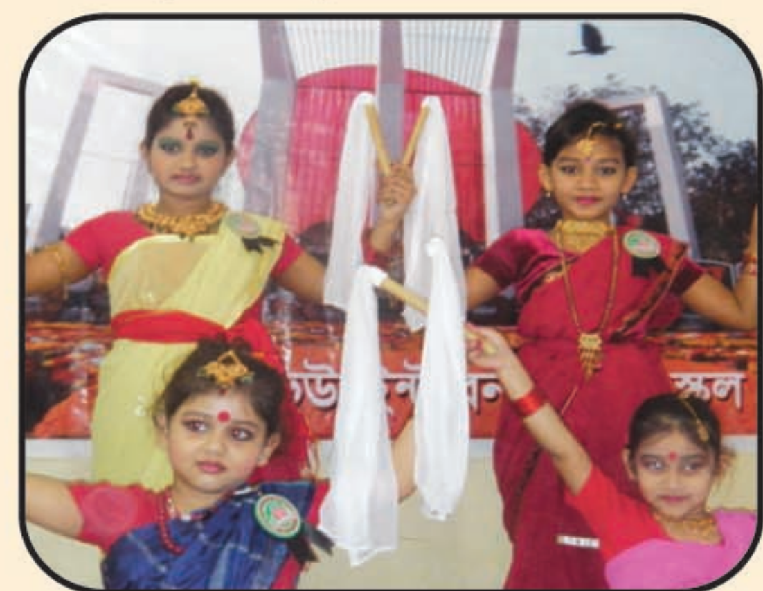
A View of Cultural Function on 21st Feb.