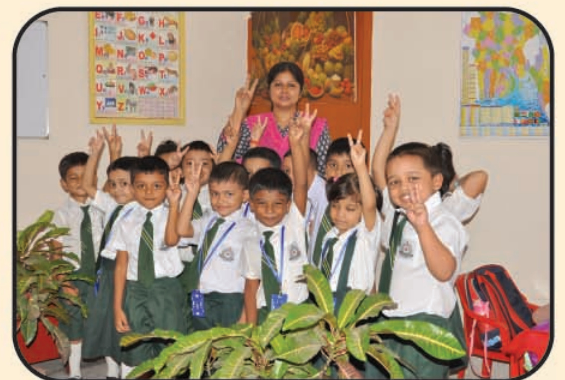
শ্রেণি কক্ষের একটি আনন্দময় দৃশ্য

For Further information please contact with