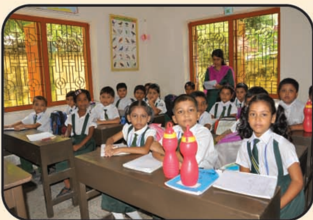
শ্রেণি কক্ষে পাঠদানের একটি দৃশ্য