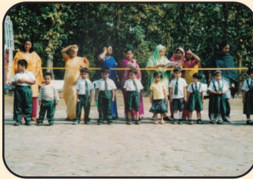
বার্ষিক বণভোজনের একটি দৃশ্য