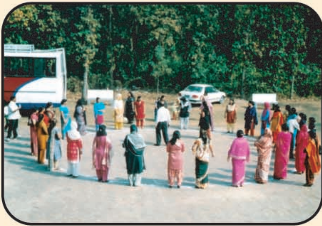
বার্ষিক অনুষ্ঠানে অংশ গ্রহণে অভিভাবকদের একাংশ