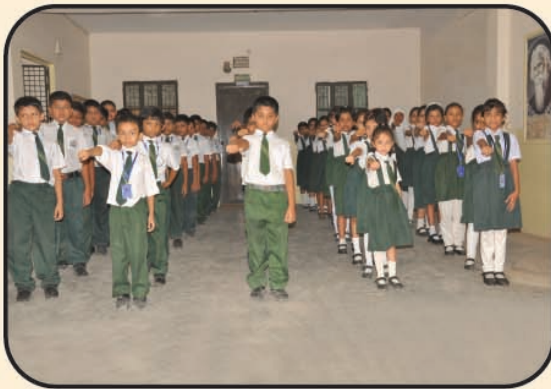
প্রাতঃ সমাবেশের একটি দৃশ্য