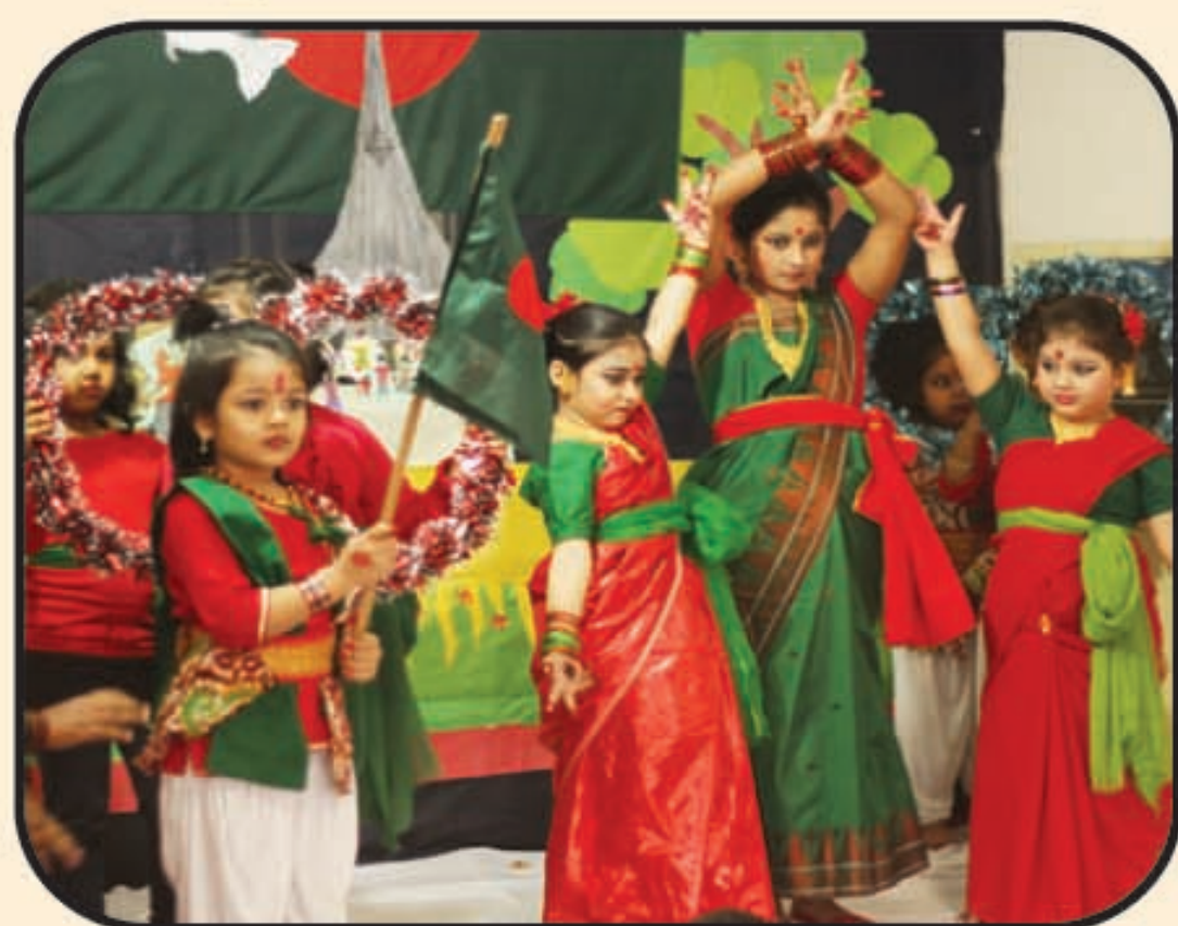
A View of Independent Day

Transport facilities are available on the basis of requirement. Charges depends on distance.