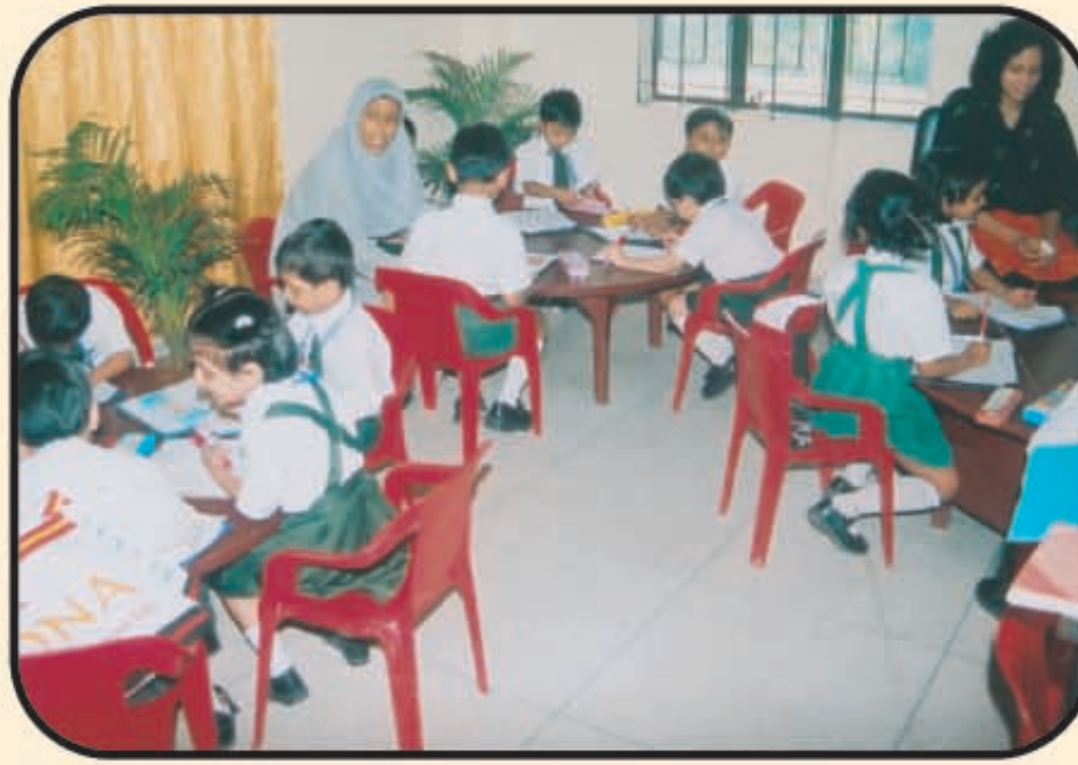
শ্রেণি কক্ষে পাঠদানের একটি দৃশ্য