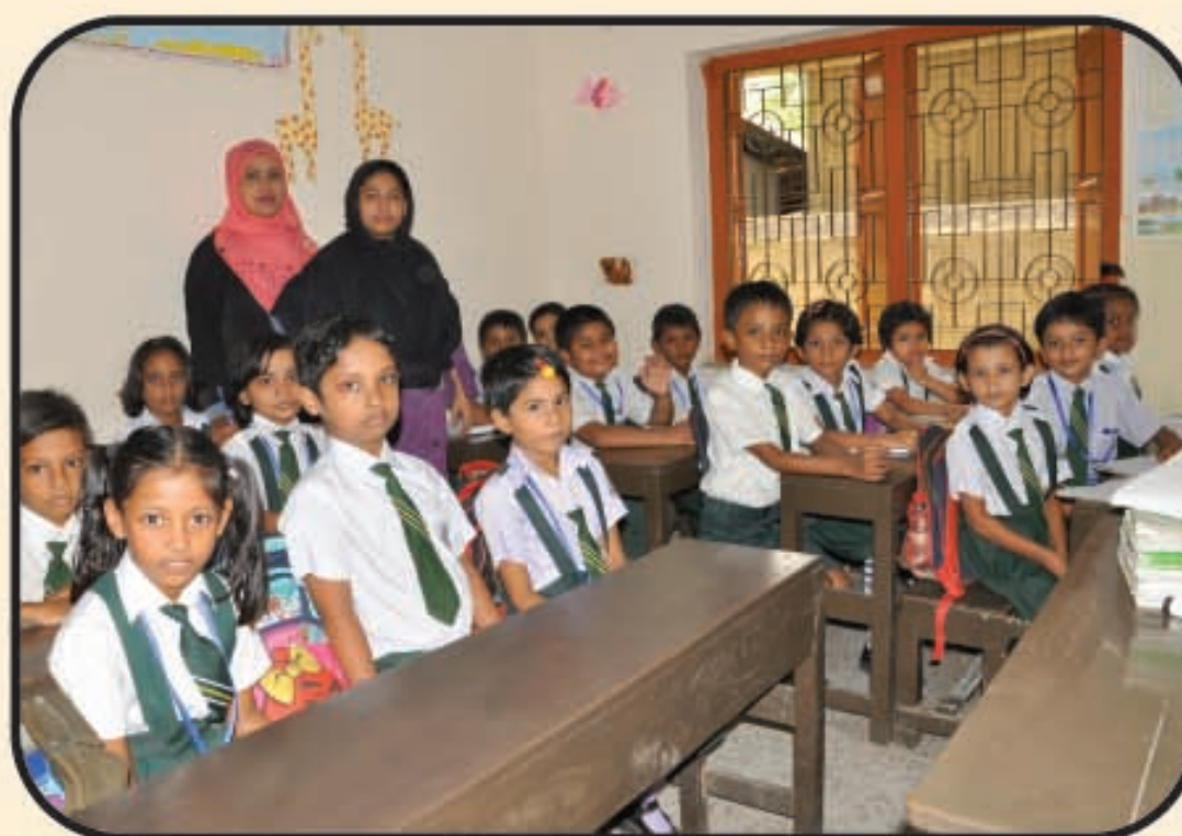
শ্রেণি কক্ষের একটি দৃশ্য