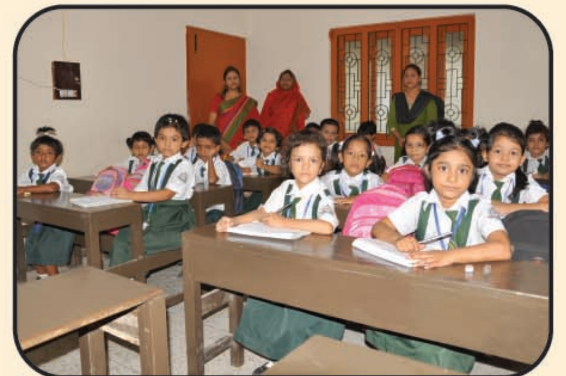
শ্রেণি কক্ষে পাঠদানের একটি দৃশ্য