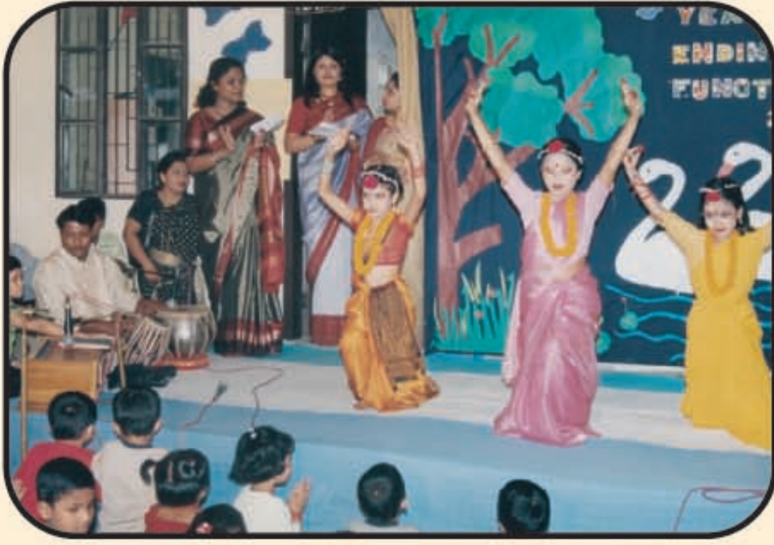
বার্ষিক অনুষ্ঠান পালনের একটি দৃশ্য

প্লে গ্রুপ ও নার্সারীতে ছাত্র/ছাত্রীদের পরীক্ষার ফলাফলের চাইতে তার শ্রেণি কক্ষের কর্মকাণ্ড, স্কুলের পরিবেশের সাথে খাপ খাওয়ানো এবং অভ্যাস মূল্যায়নের ভিত্তিতে গ্রেড/ নম্বর প্রদান করা হয়। চূড়ান্ত ফলাফল নিরূপন পদ্ধতি ডায়েরীতে উল্লেখ করা আছে।