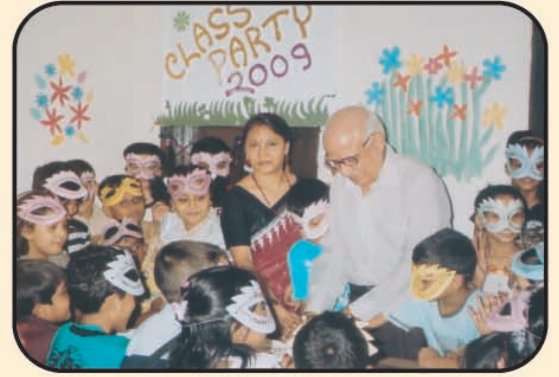
ক্লাস পার্টির একটি দৃশ্য