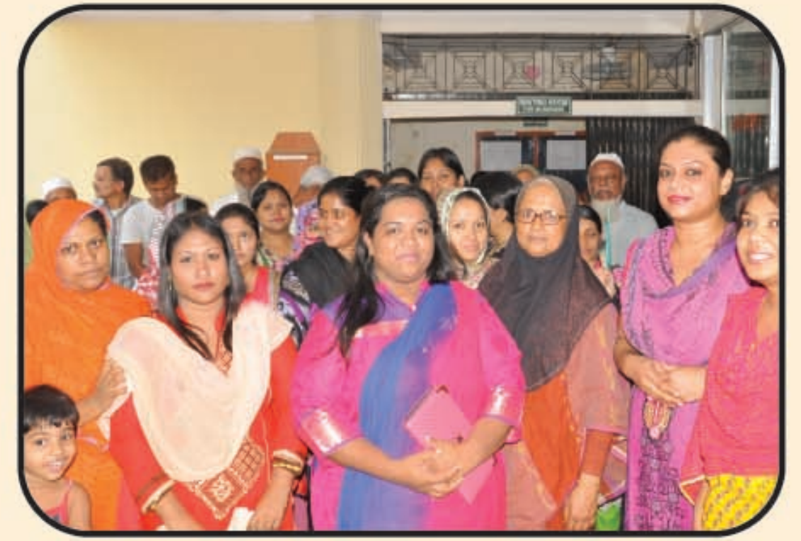
ক্লাস ছুটির পূর্বে অভিভাবকদের একাংশ