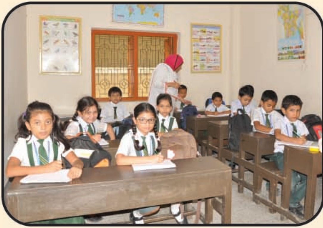
শ্রেণি কক্ষে পাঠদানের একটি দৃশ্য