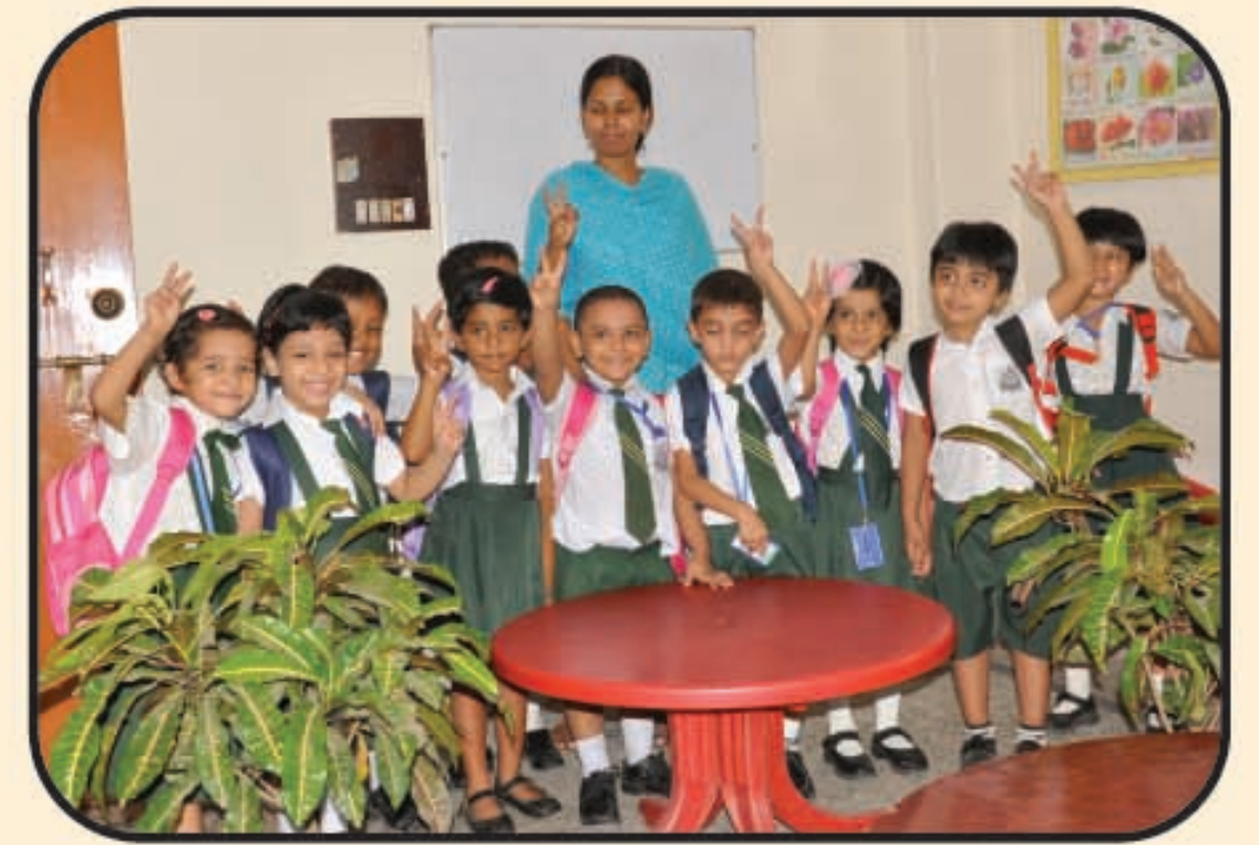
শ্রেণি কক্ষের একটি আনন্দময় দৃশ্য