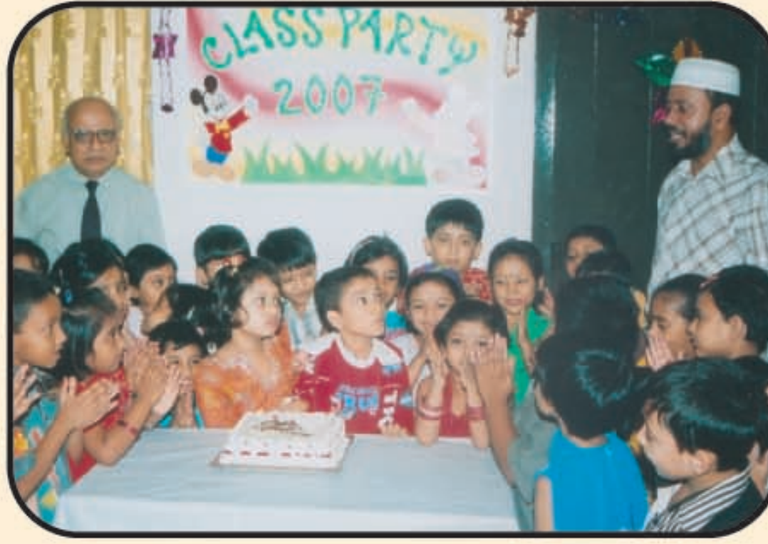
ক্লাস পার্টিতে ছাত্র-ছাত্রীদের একাংশ