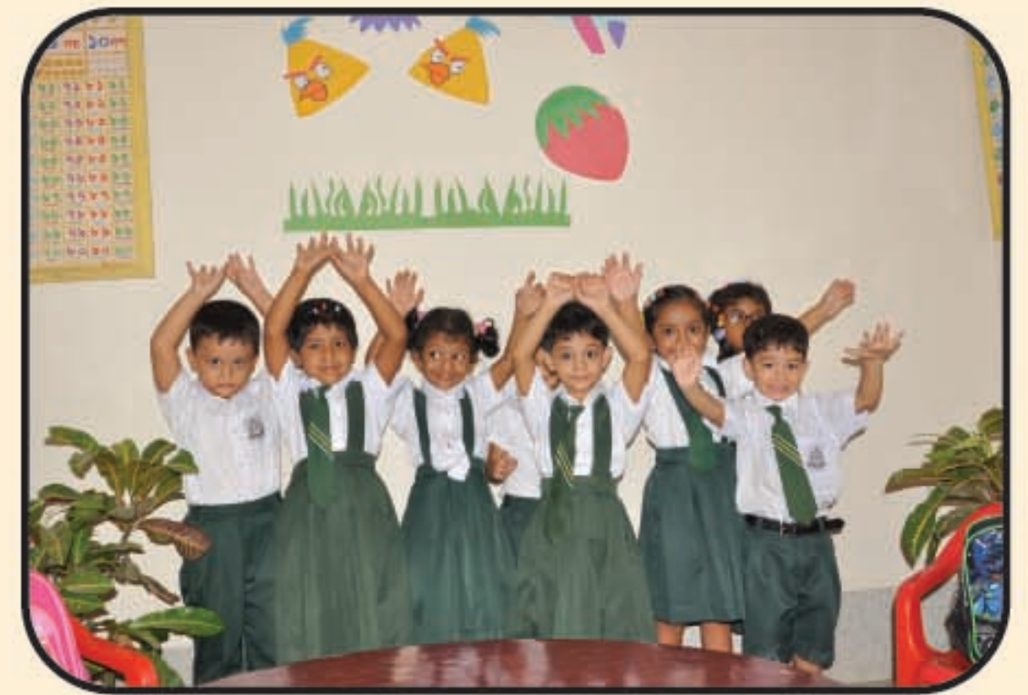
প্লে-গ্রুপের শিক্ষার্থীদের আনন্দময় একটি দৃশ্য